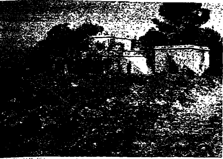
حفر اصحابها الغارة الاسرائيلية